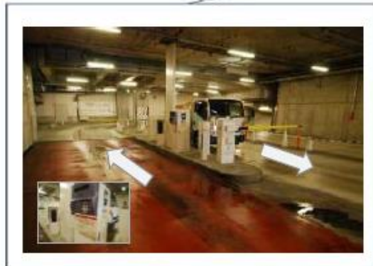
B2 入口ゲート(チケット発券機)