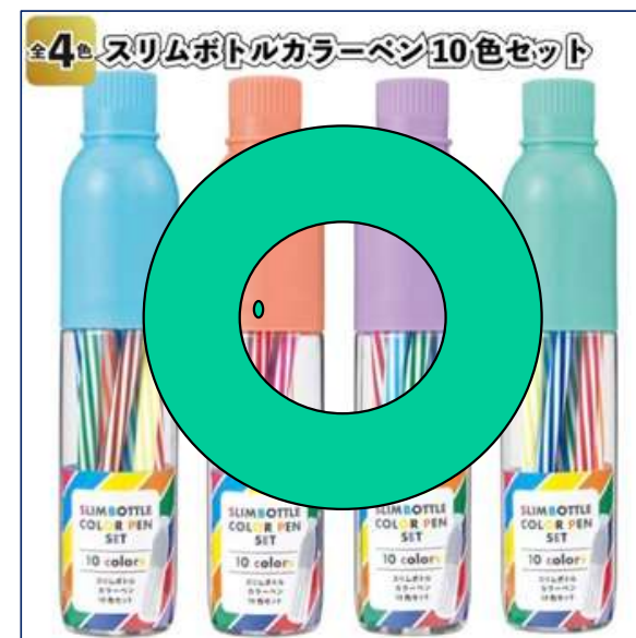
■ スリムボトルカラーペン 10色セット