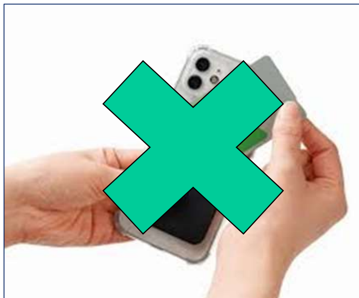
■ シリコンカードポケット