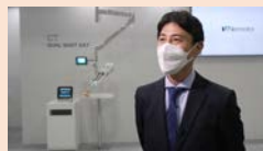
インタビュー3分～4分