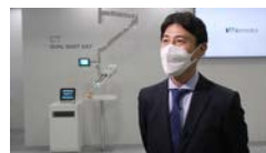
インタビュー1分～2分