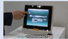
製品～3カット (指定テロップ挿入有り) ※インタビュー無し