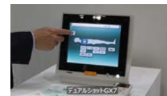
製品～3カット (指定テロップ挿入有り)