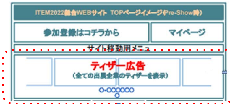
●TOPページに掲載するバナーページ (数秒表示のローテーション)