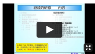
講義動画 (6) (品質編 2) 継続的研修委員会 委員 小林 伸一