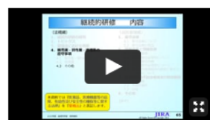
講義動画 (4) (法規編 4) 継続的研修委員会 委員 柏倉 正明