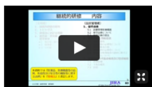
講義動画 (5) (品質編 1) 継続的研修委員会 委員 戸澤 匡広