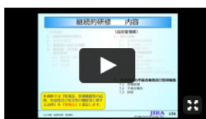
講義動画 (7) (品質編 3) 継続的研修委員会 委員 高松 洋子