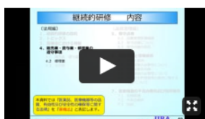
講義動画 (3) (法規編 3) 継続的研修委員会 委員 渡辺 一哉