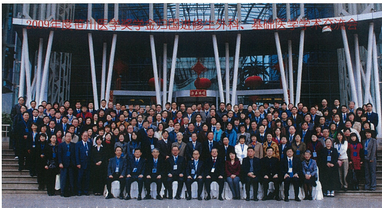
写真：2009年度笹川医学奨学金進修生同学会学術交流会