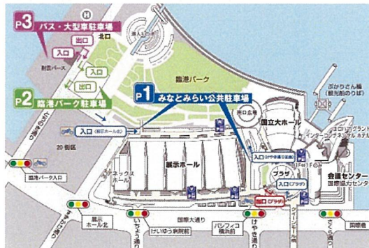
『横浜マラソン2017』(10月29日)開催に伴う駐車場利用の一部制限について