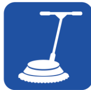
• 掃除用具 • ポリッシャー