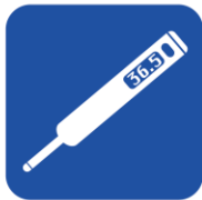
• 体温計 • 血圧計 • 電極類