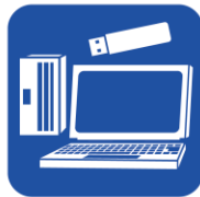
• USB/SD/PC/ ACアダプター/ 外付けHDD 等