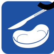
• 医療用鋼製小物 (メス・留置針) • 膿ぼん