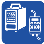
• 輸液ポンプ (とくにACアダプター) • 輸液ライン用キャップ