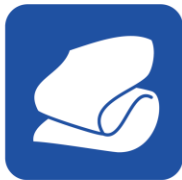
• サーマフレクト毛布 (アルミ裏打ち毛布)