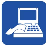
• MR検査で影響を受ける恐れのある医療機器