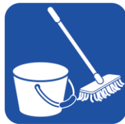
• バケツ • モップ等