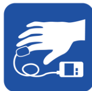
• パルスオキシメータ • バイタルサインモニター