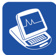
• ペースメーカープログラマー