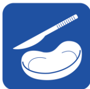
• 医療用鋼製小物 (メス・留置針) • 膿ぼん